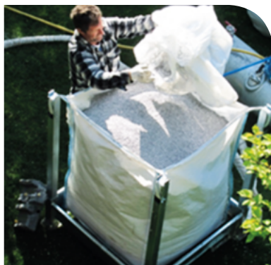
Silo di caricamento in cantiere.