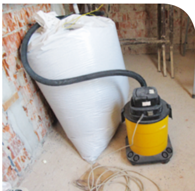
Insufflaggio in appartamento durante la ristrutturazione.